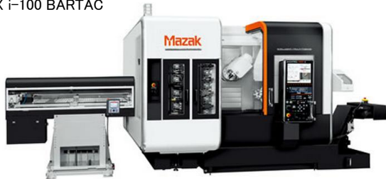
INTEGREX i-100 BARTAC

機械加工業の皆さん、棒材加工に特化したコンパクト複合機、ヤマザキマザック『INTEGREX i-100』のご紹介です！この工作機械は、棒材加工専用のインテリジェントバーロータシステムにより、残材最小化、棒材突き出し量自動送りといった機能を利用できます。多品種少量・変種変量生産の自動化・効率化に貢献し、お客様にとっては儲かる加工機械として強い武器となります！ぜひ、営業担当までお問合せください！