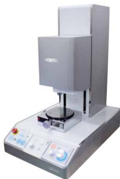
非接触三次元粗さ・形状測定機『Opt-scope』

今回は、来年1月頃に発売が予定されている東京精密の非接触三次元粗さ・形状測定機、『Opt-scope』をご紹介します。粗さ測定を日常的に実施されている機械加工業や射出成形業などのお客様は必見です！当機械は、部品の表面粗さ・形状を非接触で短時間に測定します。触針式測定機と比較すると、実に100倍以上の時間短縮が可能です！お使いいただければ、お客様の粗さ測定業務の工数を大幅に削減できます！さらに、この『Opt-scope』の価格は、なんと1,000万円を切ります。非接触三次元粗さ・形状測定機を、低価格で導入することができます。『Opt-scope』のお求めは、お気軽にエイティックへご相談ください！