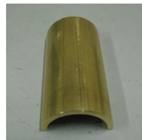
素材：真鍮 サイズ：φ60 ハーフ L110

非鉄金属の真鍮素材の加工品事例をご紹介します。当事例は、φ60でL110mmの円筒形状を半分にカットした部品となります。商社としての幅広いネットワークを活用して、ご提供いただいた図面の部品を製作するために最適な加工業者を選定し、徹底して納期フォローも行いますので、お客様は安心してご依頼いただけます。非鉄金属の部品加工のご依頼のことならエイティックの営業担当までお気軽にご相談くださいませ！