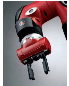
ビジョンシステム (Cognex社製カメラを搭載)