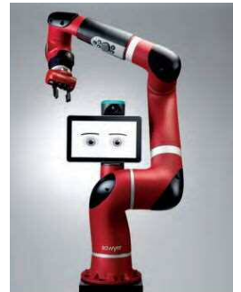
自由度 7アーム (リーチ: 1260mm)

Sawyer は、米国 Rethink Robotics 社が開発・生産するロボットで、同社特有の技術を活かした単腕型・高性能協働ロボットです。特徴と致しましては、高感度フォースセンシングを用いた衝突検知機能を搭載しており、人の作業現場へ導入できます。また、Rethink Robotics 社が保有する人工知能の技術を生かし、専門的なプログラミング知識なしでロボットにさせたい作業を設定することができます。その他には、移設時の据付や調整が容易なため、1台で多品種小ロットの生産現場にも適用でき、内臓ソフトウェア「Intera」のバージョンアップにより生産現場の要求に対応することができます。少子高齢化や都市化を背景とした労働力不足に対して、これまで人が行っていた作業を自動化したいというお悩みにお答えすることができます。詳細に関しましては、エイティックまでご連絡下さい！