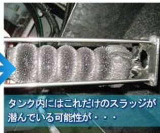
タンク内にはこれだけのスラッジが潜んでいる可能性が・・・